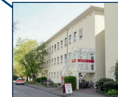
Uniblutbank - Haus 29