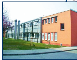
Institut für Immunologie Haus 26