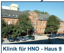
Klinik für HNO - Haus 9