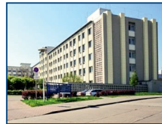
Zentrallabor - Haus 39