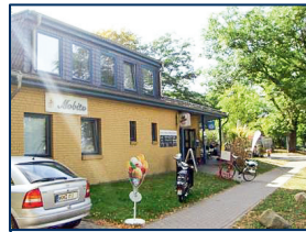
Mobitz Cafeteria & Restaurant