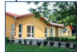
Elternhaus - Haus 93