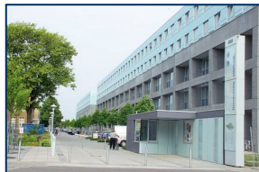
Kinderchirurgie Klinik für Gastroenterologie Klinik für Neurologie Krankenhausseelsorge Haus 60a