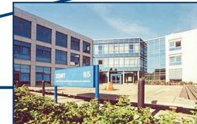
ZENIT-Gebäude - Haus 65