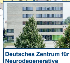
Deutsches Zentrum für Neurodegenerative Erkrankungen (DZNE) Haus 64