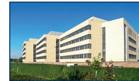
Leibniz-Institut für Neurobiologie (LIN)