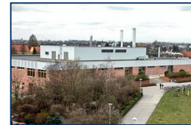
Zentralbibliothek Mensa-Gebäude - Haus 41